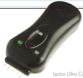
Lector Ultra Contact